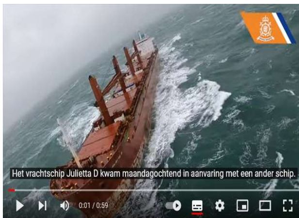
Evacuatie bemanning vrachtschip Julietta D door SAR-helikopters

Het is eind januari 2022, langs de Hollandse kust staat een Noordwester storm. De hele dag is de op drift geraakte bulkcarrier JULIETTA D in het nieuws. Het schip is van het anker geslagen, ramt vervolgens een andere ankerligger, met een groot gat ter hoogte van de machinekamer als gevolg. De woeste golven beginnen het schip binnen te lopen. Er ontstaat een noodsituatie. Intussen zwakt het stuurloze schip door een windmolenpark. Ook hier wordt schade veroorzaakt. De kapitein besluit dat de bemanning het schip moet verlaten. Een reddingsactie komt op gang. Met behulp van helikopters wordt de voltallige crew geëvacueerd. Dat is sneller geschreven dan gedaan. In deze onstuimige omstandigheden gaan zowel het schip, als de erboven hangende helikopter enorm te keer.